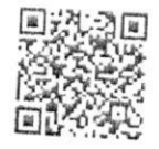
QR Code ลงทะเบียนออนไลน์