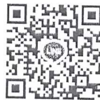
QR code : Line กลุ่มผู้สนใจเรียนสาธารณสุขมวล.