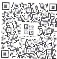
QR code รายละเอียดการรับสมัครและทุนการศึกษา