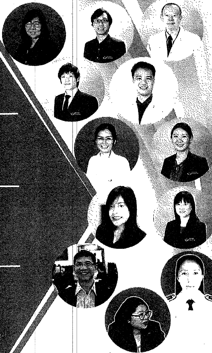
ดูรายละเอียดและสมัครได้ที่