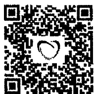
QR Code ลงทะเบียนออนไลน์

จึงเรียนมาเพื่อโปรดพิจารณาให้บุคลากรในหน่วยงานเข้ารับการประชุม และขอความอนุเคราะห์เผยแพร่ข้อมูลดังกล่าวให้ทราบโดยทั่วกันด้วย จะเป็นพระคุณยิ่ง