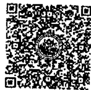
QR-Code เพื่อสมัครอบรม

การสำรองห้องพัก ท่านสามารถจองห้องพักกับทางโรงแรมโดยสแกน QR-Code สำหรับจองห้องพัก หากท่านจองห้องพักภายหลังห้องพักอาจเต็มได้ และอาจจะไม่ได้ห้องพักพิเศษซึ่งเป็นอัตราค่าที่พัก โรงแรมรอยัลริเวอร์ ๒๑๕ ซอยเจริญสุขนิเวศน์ ๓๖/๑ แขวงบางพลัด เขตบางพลัด กรุงเทพฯ ๑๐๗๐๐ โทรศัพท์ : ๐๒-๕๒๒-๕๒๒๒ โทรสาร : ๐๒-๕๓๓-๕๕๘๐ E-mail : rsvng@royalriverhotel.com