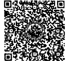
QR-Code เพื่อสมัครอบรม

**หากโอนเงินค่าลงทะเบียนเรียบร้อยแล้ว กรุณาส่งหลักฐานการโอนเงินมาที่ ID Line : thailocalsu หรือติดต่อที่ คุณบุลู มือถือ ๐๘ ๕๒๒๒ ๔๒๑๘ โดยระบุชื่อผู้เข้ารับการฝึกอบรมหน่วยงาน และหลักสูตรที่เข้ารับการฝึกอบรมให้ชัดเจน**