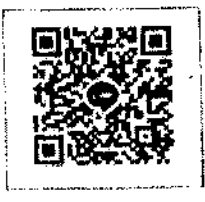
QR-Code เว็บไซต์ QR-Code เพื่อสอบถามข้อมูล