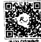
QR CODE สำหรับจองห้องพัก

การสำรองห้องพัก ว่างสัปดาห์ละ ๑ ครั้งทางโรงแรมโดยคนงาน QR Code สำหรับจองห้องพัก หากท่านจองห้องพักแล้วจะมีธงห้องพักเต็มได้ และอาจจะไม่ได้ห้องพักราคาพิเศษ โรงแรมรอยัลริเวอร์ที่ ๓๖๘ ถนนสุขุมวิท แขวงบางพลัด เขตบางพลัด กรุงเทพฯ ๑๐๗๐๐ โทรศัพท์ ๐๒๒๑๕ ๕๖๘๖ โทรสาร ๐๒-๕๓๓-๕๕๘๐ E-mail: bangplad@riverhotel.com