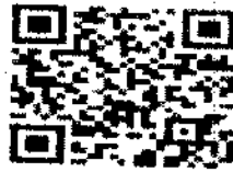
กำหนดการโครงการ