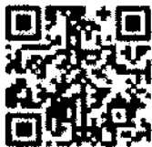
QR CODE ลงทะเบียนเข้าร่วมอบรม

จึงเรียนมาเพื่อโปรดพิจารณา และประชาสัมพันธ์ให้ผู้สนใจทราบต่อไปด้วย จะเป็นพระคุณ