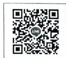
QR-Code เพื่อสมัครอบรม QR-Code เพื่อสอบถามข้อมูล